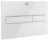
PL7 DUAL (ONE) - Placa de accionamiento con descarga dual con acabados cristal